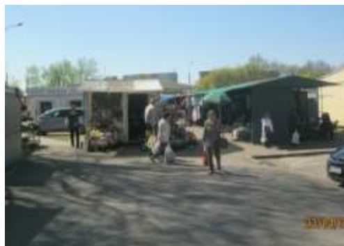
Fot.4. Elementy dysharmonizujące krajobraz osiedla Lecha – substandardowe pawilony handlowe na lokalnym targowisku