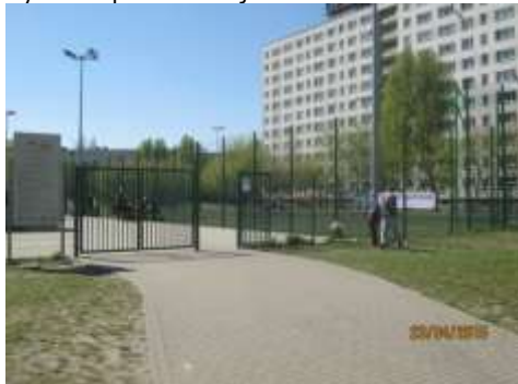
Fot. 5. Nowe obiekty sportowo-rekreacyjne – boiska Orlik 2012 przy szkole podstawowej nr 51 im. Bolesława Szwarca