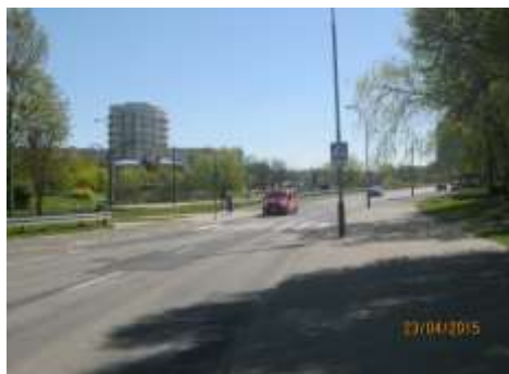
Fot. 7. Widok z ul. Piaśnickiej na sąsiadujący z terenem mpzp użytek ekologiczny „Traszki Ratajskie” (mpzp „Osiedle Tysiąclecia”).