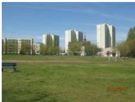
Fot. 3. Rozległy teren przeznaczony w projekcie mpzp pod lokalizację usług sportu i rekreacji (US)