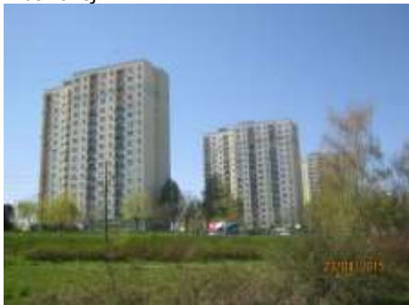
Fot. 1. Widok z parku na osiedlu Tysiąclecia na trzy XVI-kondygnacyjne budynki mieszkaniowe wielorodzinne przy ul. Piaśnickiej