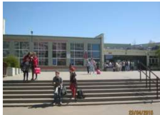
Fot. 6. Szkoła Podstawowa nr 51 im. Bolesława Szwarca (teren 2UO)