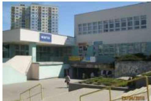
Fot. 2. Duży budynek usługowy przy ul. Chartowo, mieszczący m.in. siedzibę Kierownictwa i Rady Osiedli Lecha i Czecha