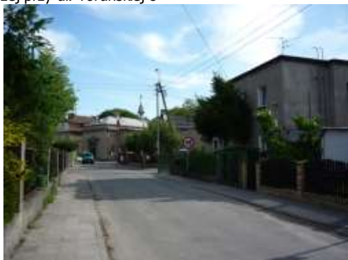
Fot. 5. Widok z ul. Toruńskiej na zabytkowy kościół pw. Opieki Matki Bożej przy ul. Toruńskiej 8