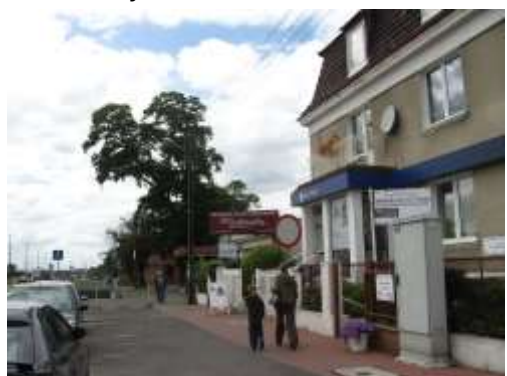
Fot. 7. Usługi w obrębie zabudowy mieszkaniowej wielorodzinnej przy ul. Warszawskiej.