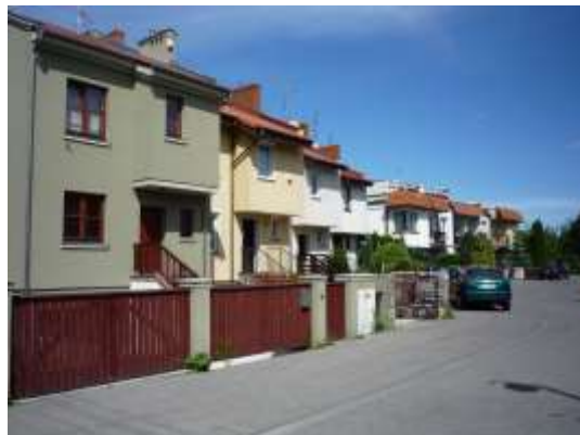
Fot. 4. Zabudowa mieszkaniowa jednorodzinna w układzie szeregowym przy ul. Radziejowskiej.