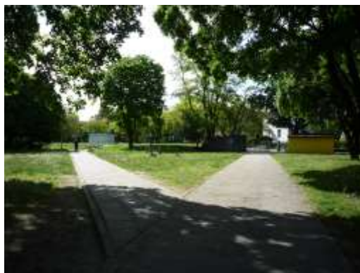
Fot. 2. Zieleń wysoka na terenie zieleńca przy ul. Kutnowskiej