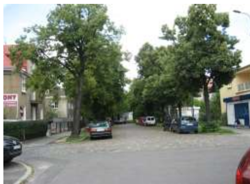
Fot. 6. Zadrzewienia z lipy drobnolistnej w ul. Łowickiej, prowadzącej do ogólnodostępnego zieleńca przy ul. Kutnowskiej.