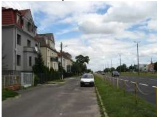
Fot. 1. Zabudowa willowa mieszkaniowa wielorodzinna zlokalizowana wzdłuż ul. Warszawskiej