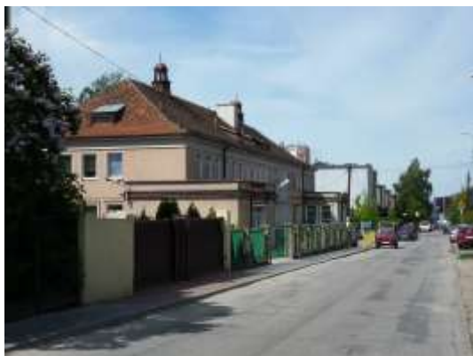
Fot. 3. Budynek dawnego żłobka „Pometu” – obecnie Przedszkole nr 45 przy ul. Trzemeszeńskiej 12