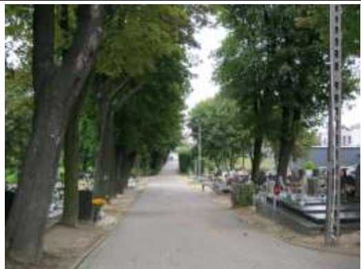
Fot. 7. Aleja drzew wzdłuż głównego wejścia na cmentarz (teren ZC )