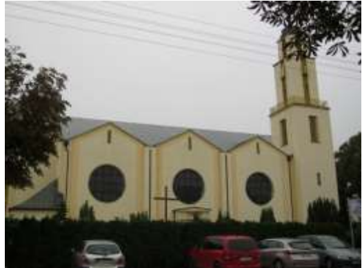
Fot.2. Widok z ul. św. Antoniego na kościół parafialny pw. św. Antoniego Padewskiego, zlokalizowany na terenie UK