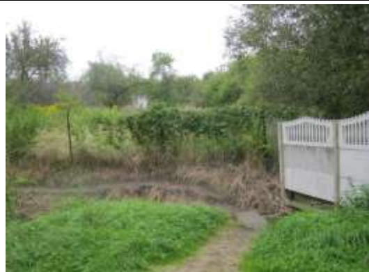
Fot. 8. Dziiki przedcept łączący teren kościoła z zachodnim wejściem na cmentarz, który docelowo ma zostać przekształcony w teren publicznego ciągu pieszego ( lkx )