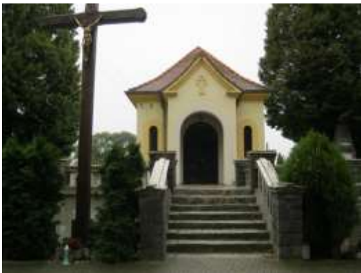
Fot. 3. Podlegająca ochronie konserwatorskiej kaplica cmentarna wraz ze schronem 3-komorowym umocnień mobilizacyjnych z 1914 roku, stanowiąca pozostałości fortyfikacji pruskich z końca XIX w., zlokalizowana w granicach terenu ZC