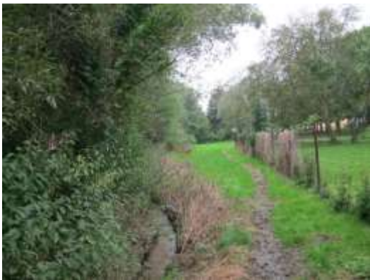
Fot. 5. Koryto ciek wodnego Starynka oraz towarzysząca mu zieleń (teren ZO/WS )