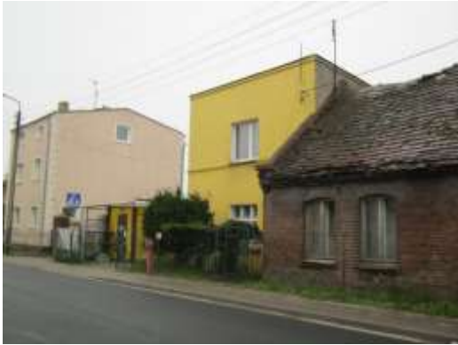
Fot. 1. Zabudowa mieszkaniowa jedno i wielorodzinna oraz drobne usługi zlokalizowane wzdłuż ul. św. Antoniego (nie objętej granicami opracowania) na terenie MN/MW