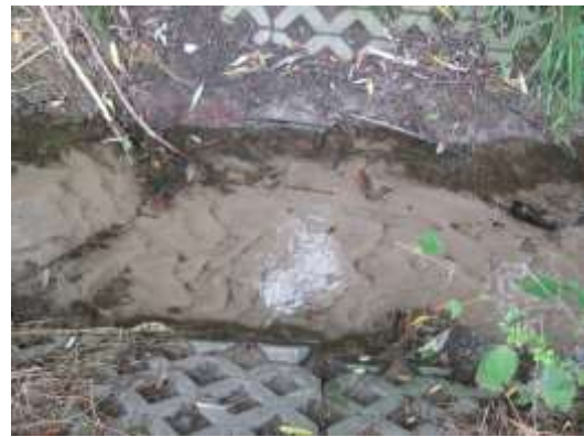
Fot. 6. Umocniony fragment koryta ciek Starynka