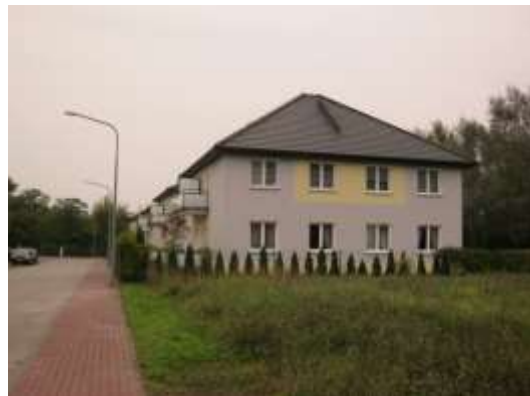
Fot.4. Nowa zabudowa mieszkaniowa wielorodzinna zlokalizowana przy ul. Nad Starynką, w obrębie terenu MN , a także zieleń synantropijna porastająca niezainwestowany jeszcze fragment terenu